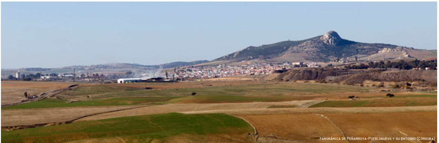
PANORÁMICA DE PEÑARROYA-PUEBLONUEVO Y SU ENTORNO (CÓRDOBA)

Junto con la zona asturiana y la sevillana de Villanueva del Río y Minas, la comarca cordobesa del Alto Guadiato constituye una de las zonas de más antiguo laboreo del carbón desde finales del siglo XVIII. Una vez abandonados hoy casi en su totalidad la extracción y la siderurgia, el Alto Guadiato ofrece un variado patrimonio industrial como testigo de una intensa actividad minera y metalúrgica en cortas, cabrias y pozos, instalaciones industriales y ferroviarias, e incluso barrios y poblados mineros.