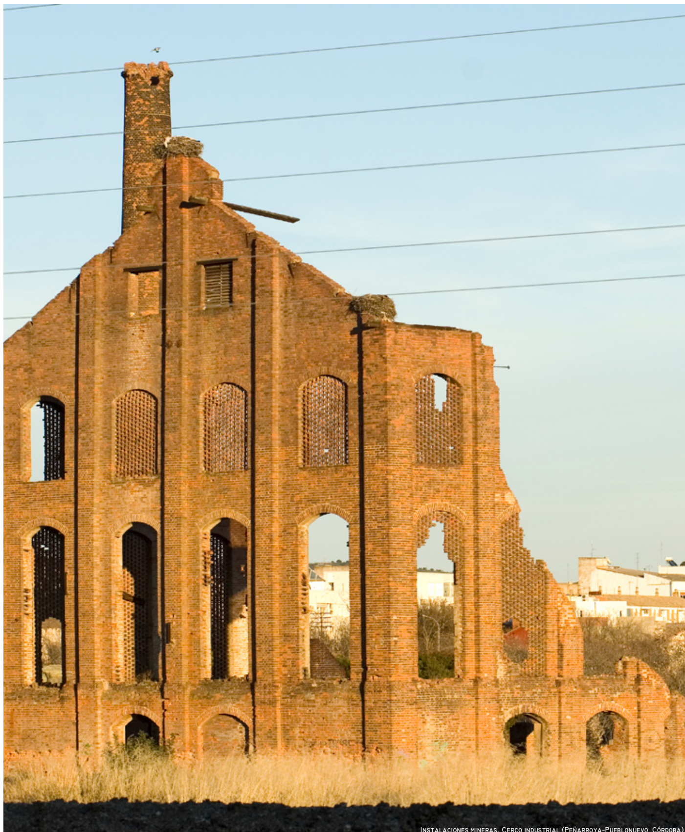
INSTALACIONES MINERAS. CERCO INDUSTRIAL (PEÑARROYA-PUEBLONUEVO, CÓRDOBA)

ÁMBITO/S: ALTO GUADIATO - CAMPIÑAS DE PEÑARROYA