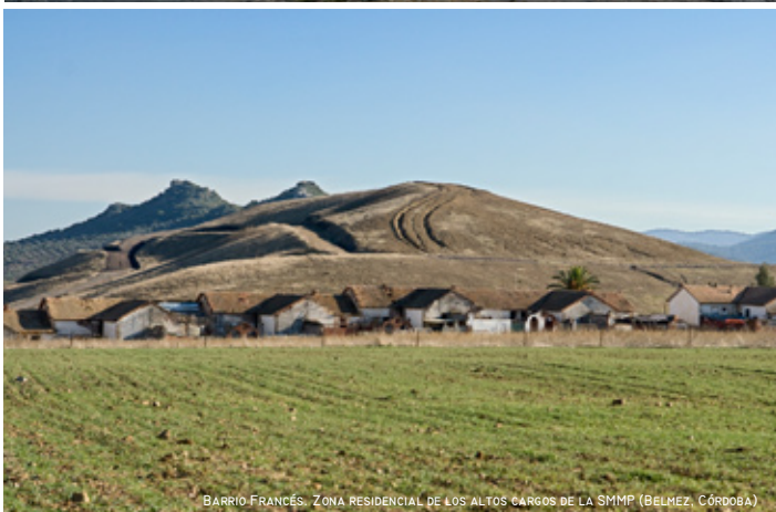
BARRIO FRANCÉS. ZONA RESIDENCIAL DE LOS ALTOS CARGOS DE LA SMMP (BELMEZ, CÓRDOBA)