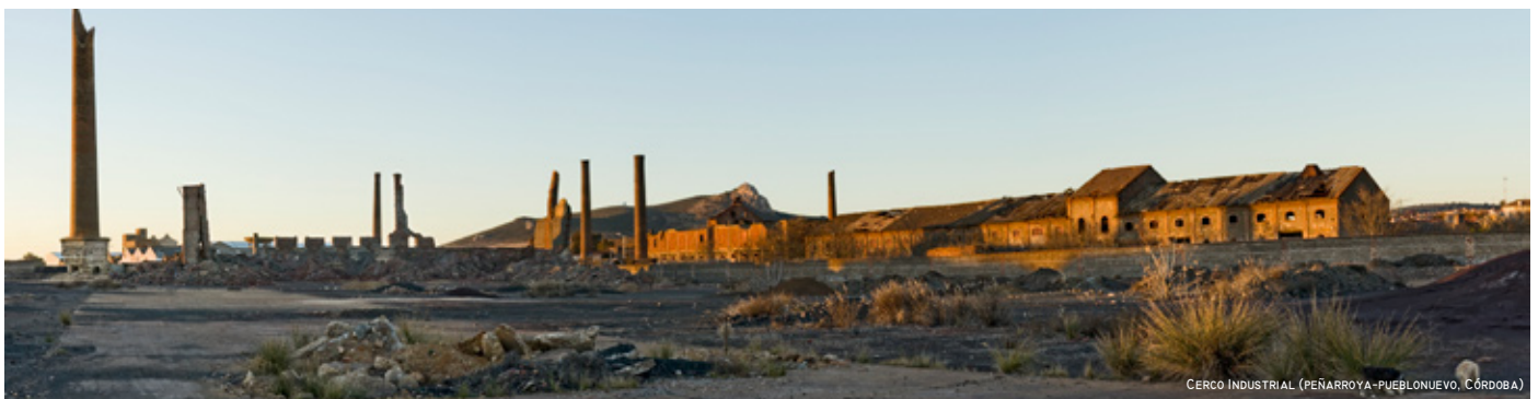
CERCO INDUSTRIAL (PEÑARROYA-PUEBLONUEVO, CÓRDOBA)