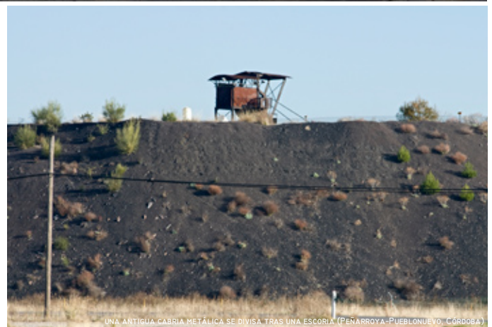
UNA ANTIGUA CABRIA METÁLICA SE DIVISA TRAS UNA ESCORIA (PEÑARROYA-PUEBLONUEVO, CÓRDOBA)